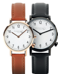
Uhr mit Notrufknopf (Elegance)