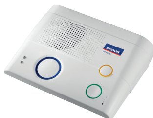
Basisstation (inkl. Freisprecheinrichtung)